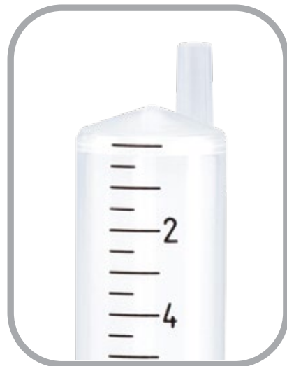
Excentrique (5, 10, et 20 ml)