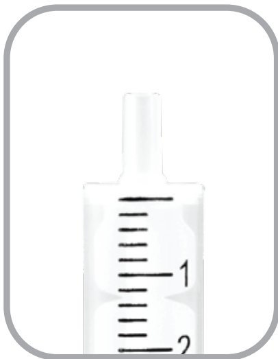
Concentrique (2 ml)